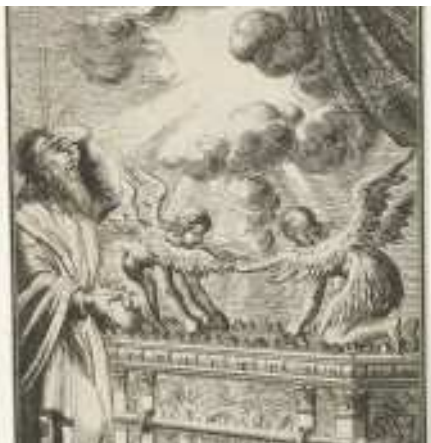
Ark des verbonds, Jan Luyken, 1683, Rijksmuseum

kunstenaars worden aangetrokken, er wordt een complete kunstacademie voor opgericht, de fraaiste materialen zijn nog niet mooi genoeg: goud, zilver en koper, blauwpurperen en roodpurperen en karmozijnrode wol, fijn linnen garen en geitenhaar, roodgeverfde ramsvellen, vellen van zeekoeien, accaciahout, lampolie, geurige specerijen voor de zalfolie en reukoffers, onyxstenen voor de priesterschort en edelstenen voor de borsttas. En later, met de tempel die Salomo in Jeruzalem bouwt, is het niet anders. Cypressen- en cederhout, bladgoud, houtsnijwerk, bloemenranken en palmetten – het kan niet op. En zo is het ook met de Hooglandse Kerk die hier al in al haar stenen en lichte glorie stond toen de stad nog uit voornamelijk houten huizen bestond.