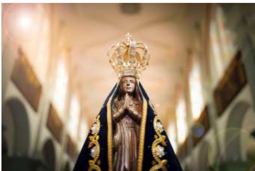
Nossa Senhora Aparecida