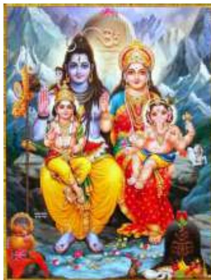
Shiva en Parvati

De betekenis is dat je als je in de nabijheid van het goddelijke staat je dan ook iets van de goddelijke kracht ervaart, een goddelijke zegen. Je wordt als het ware deelgenoot van de godheid. In de Bhakti-traditie gaat het om de liefde voor de godheid aan wie je je helemaal toewijdt. Het woord 'bhakti' betekent eigenlijk 'sharing', deelgenoot worden. Zoals jij de godheid wil zien, kan de godheid in zijn afbeelding jou zien, oog in oog. In die deelgenootschap ervaar je spirituele kracht, want in de afbeelding ervaar je zijn of haar aanwezigheid. Een oude mythe vertelt hoe de godin Parvati een keer speels met haar handen de ogen van haar echtgenoot Sjiva bedekte. Terstond werd heel de wereld in duisternis gehuld. De goden moeten hun ogen openhouden – dat doen ze ook – zodat de wereld in stand blijft. De mensen 'zien' op hun beurt de goden. De oude wijzen worden