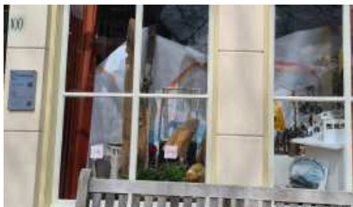
Opstelling kunstwerk in RAP100

In het noordwesten van Jordanië ligt de berg Nebo. Het is voor de drie monotheïstische godsdiensten: jodendom,