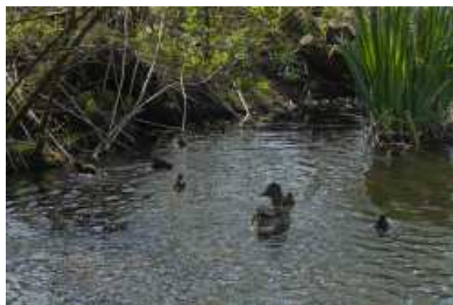
Vrouwtje Wilde Eend met jongen