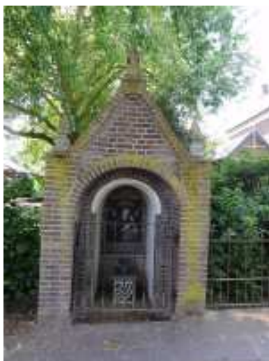
Huize Padua te Boekel