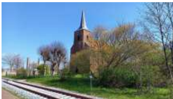
Het kerkje van Heveskes

De provincie Groningen is bezaaid met dergelijke middeleeuwse kerkjes. Vaak in het midden van een dorp met de huizen eromheen, soms solitair op een wierde in het land. Het zijn merktekens, bakens in het vlakke land, met de kerktorens als vingerwijzing naar de hemel. In die zin werd onlangs in Trouw (6 mei