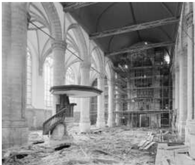
Restauratie Hooglandse Kerk, foto Rijksmonumenten