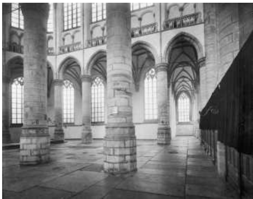
Hooglandse kerk (St Pancras) te Leiden

Ik had er wel eens even willen kijken. En ik vraag me af, wat is mij nou liever: die witte lichte leegte in het gedruis van de stad of dat religieuze universum waarin de stad de contingentie van het leven met zijn pijn en verdriet, zijn vreugde en hoogtepunten verzoende met de vreeswekkende en barmhartige God? Die vraag is niet van vandaag of gisteren. Toen sprak Salomo: ‘Heer, u hebt gezegd dat u in een donkere wolk wilde wonen. Welnu, ik heb voor u een vorstelijk huis gebouwd, dat voor altijd uw woning kan zijn’. De Here God boft toch altijd maar weer met zijn gelovigen; die regelen ‘t wel voor ‘m. Dit is de grondlijn in de bijbel: God trekt mee met zijn volk, hij woont tussen de gordijnen, in een tent, een tabernakel die je weer kunt opvouwen en meenemen. De menszoon kan zijn hoofd nergens te ruste leggen. De God van Israël en de Messias die het heil aan alle volkeren brengt — zij zijn de God die met ons mensen meetrekt door de tijd, door geschiedenis. De God die zich niet laat fixeren, die zich niet in een hokje laat opsluiten, of in een boek (zelfs niet in een heilig boek) of in een setje waarheden, of regels en regeltjes. Maar toch... Toch is het halve bijbelboek Exodus gewijd aan het ontwerp en de uitvoering van de tabernakel, die heilige tent die Israël 40 jaar met zich meesleepte door de woestijn. De beste