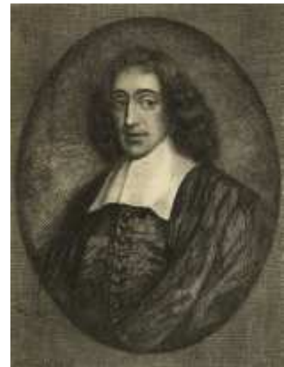
Baruch Spinoza (1632-1677)