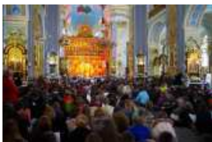
Viering in Taizé

Mijn eerste verblijf in Taizé, zomer 1978, betekende een keerpunt in mijn leven. Mijn verwachtingen waren hoog gespannen door de laaiend enthousiaste verhalen over heel bijzondere ervaringen in Taizé, een dorpje in Bourgondië. Daar is een oecumenische Gemeente van Broeders. Al vele