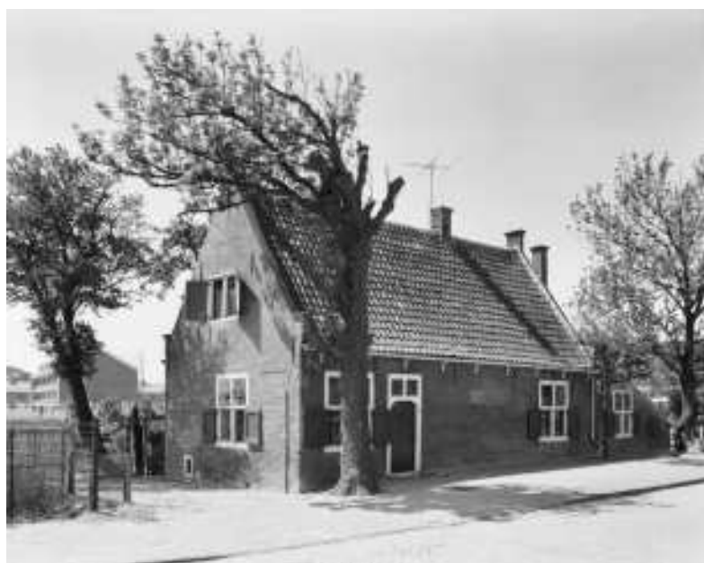
Spinozahuisje te Rijnsburg