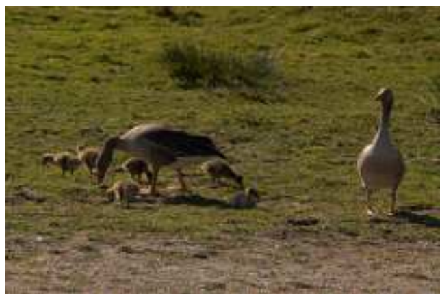
Mannetje en vrouwtje Grauwe Gans met jongen

Twee bijzondere waarnemingen willen we graag tonen.