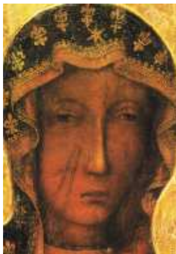
Detail van het icoon De Zwarte Madonna in Czestochowa (Polen)