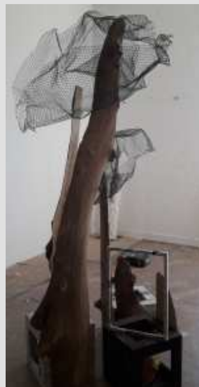
zie ook artikel over het kunstproject op pg 19