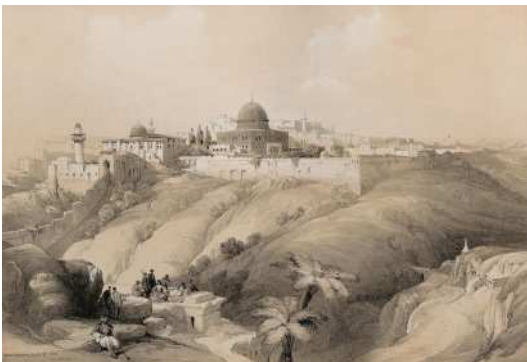
Jeruzalem, voor heel veel mensen op aarde een heilige plaats