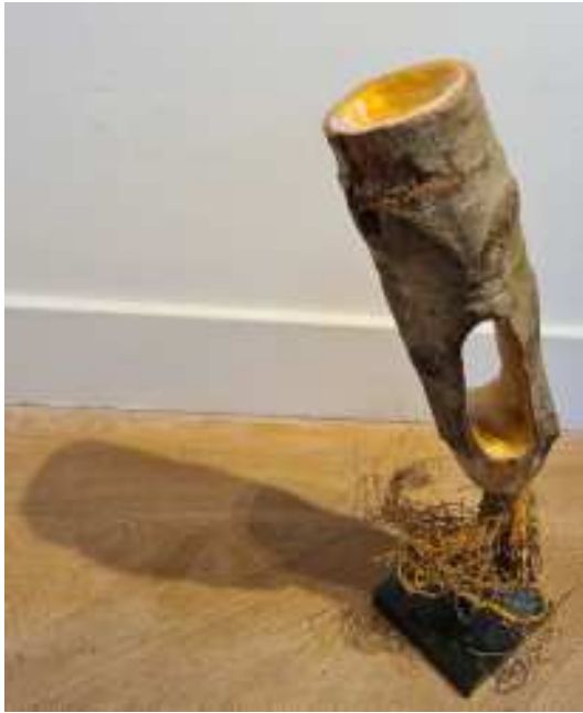
beeld: stronk, wortels, goudverf, staal, sokkel van serpentin

zie ook het artikel over het kunstproject op pg 19