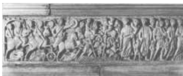
Doortocht door de Rietzee, sarcofaag, 4e eeuw. Saint Trophime, Arles.

je denken en doen als je weer thuis komt. Elke pelgrimstocht gaat naar een Heilige Plaats. Net zoals het jodendom kent de christelijke wereld vele heilige plaatsen. Ze zijn altijd gebonden aan gebeurtenissen en personen waar, in het geloof van mensen, God of het heilige intenser dan elders aanwezig is. Dat kan lijken op magie of op een afgodische verering van een stuk materie als een beeld of relikwie. Maar daarmee doe je de ervaring te kort denk ik. Op al deze plaatsen gaat het om symbolen,