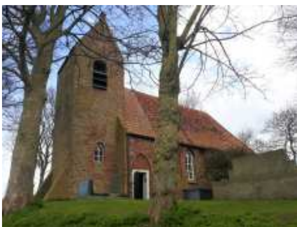
Het kerkje van Oostum

www.kerkheveskes.nl en www-groningerkerken.nl