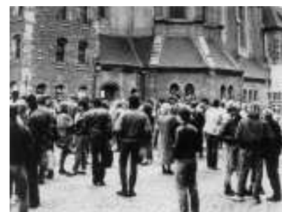
Demonstratie na een herdenkingsdienst op 9 oktober 1989 in de Nikolaikirche in Leipzig