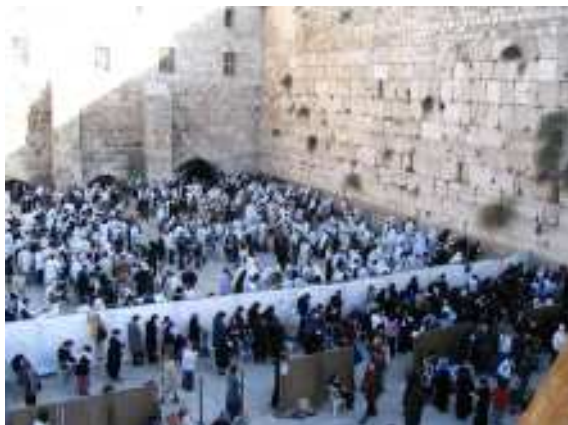
De westmuur [klaagmuur]

Want het monotheïsme brengt een zekere onverdraagzaamheid met zich mee. Er is maar één God, en die is er weliswaar voor iedereen, maar dan wel op onze manier. Het eigen gelijk wordt geclaimd met een fanatisme dat geen ruimte laat voor andere versies van hetzelfde verhaal en zeker niet voor andere verhalen over diezelfde plaats. Daarom is het zo onrustig in Jeruzalem. Ook christenen onderling ruziën over heilige plaatsen, zoals rond het graf van Jezus. Midden in de oude stad staat de