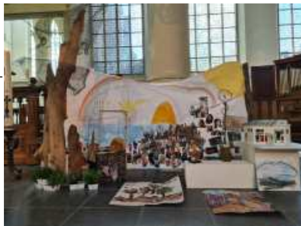
Opstelling ‘Heilige Plaatsen’ in de Hooglandse Kerk

Tijdens de meditatie kwamen er herinneringen bij mij op van mijn laatste reis door Jordanië. Ik stond aan de oever van de Jordaan bij de staf van Mozes. Aan de overkant zag ik Israël liggen. Daar was ik eens met mijn moeder tijdens een rondreis door het beloofde land. In Jeruzalem zagen we onder andere de Goudenkoepelmoskee, christelijke kerken en diverse synagogen, Yeshiva’s en de Klaagmuur. Ik mediteerde dat na corona er een einde zou komen aan de verdeeldheid tussen alle volken. En komt tot vervulling Jeremia 3: 16-17. ”Te dien tijde zal men in Jeruzalem noemen de troon des Heren en alle volken zullen zich daarheen verzamelen.” Er zal dan niet alleen gebeden worden Shêma Jisra’él haShém Élohénú