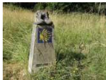
pelgrimstocht naar Santiago de Compostela

tocht beschouwt, dan kunnen daarin vier momenten onderscheiden worden die voor een spiritualiteit van belang zijn: allereerst het zich op weg begeven en vervolgens de tocht zelf, dan komt men aan op de plaats van bestemming en keert men daarna weer terug naar huis. Deze momenten zijn op verschillende wijzen met elkaar verbonden: het motief bepaalt de wijze waarop men op reis gaat. Ga je alleen, samen met anderen? Wat neem je mee, ga je te voet of op een andere manier, waar ga je slapen? De ervaringen op de plek van bestemming kleuren mede de betekenis en de invloed op het leven na terugkeer. Wie ontmoet je daar, wat doen de symbolen met je, de rituelen? Wat je meeneemt in je hart beïnvloedt