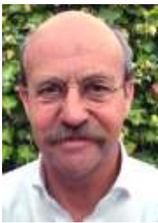
Kunstcommissie Ekklesia Leiden