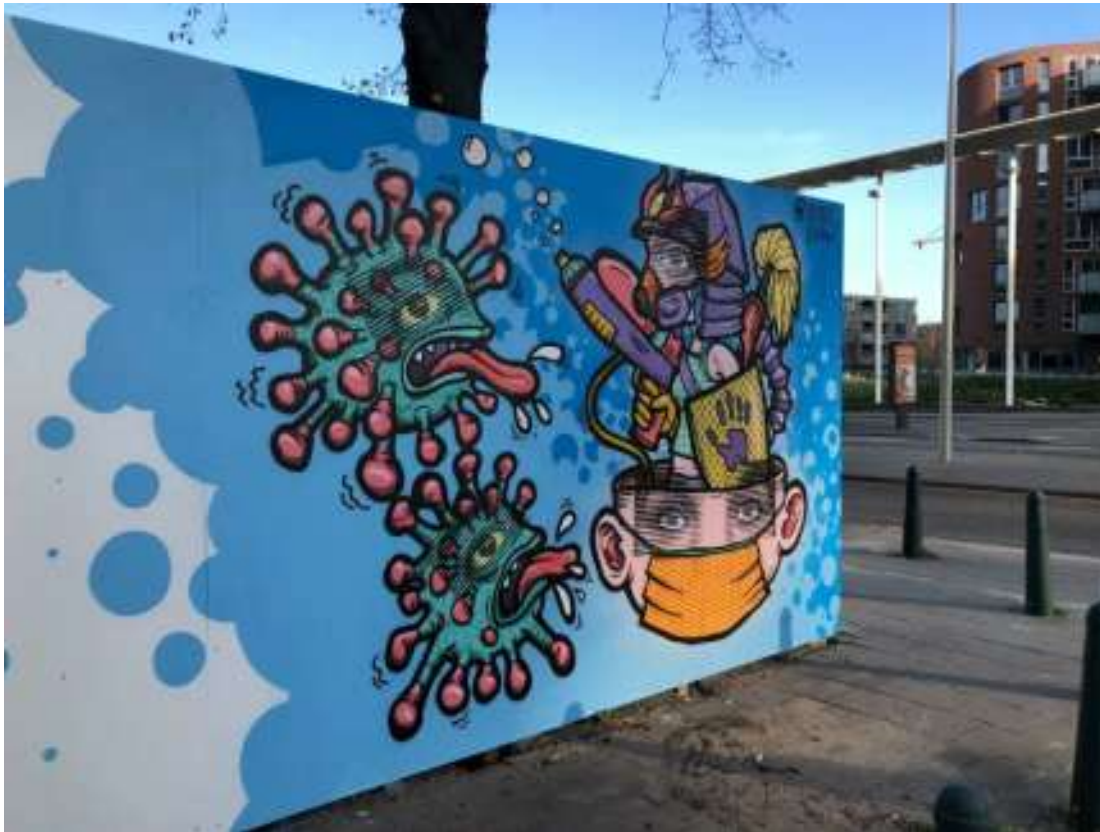
Muurschilderingen in Den Haag (Laakkwartier) - Sophia den Breems Gordon Meuleman SOGOshow

status en allochtonen. Met allerlei laagdrempelige methoden, als lokale prik-bussen, wordt geprobeerd deze groepen te bereiken en hen over te halen zich te laten inenten.