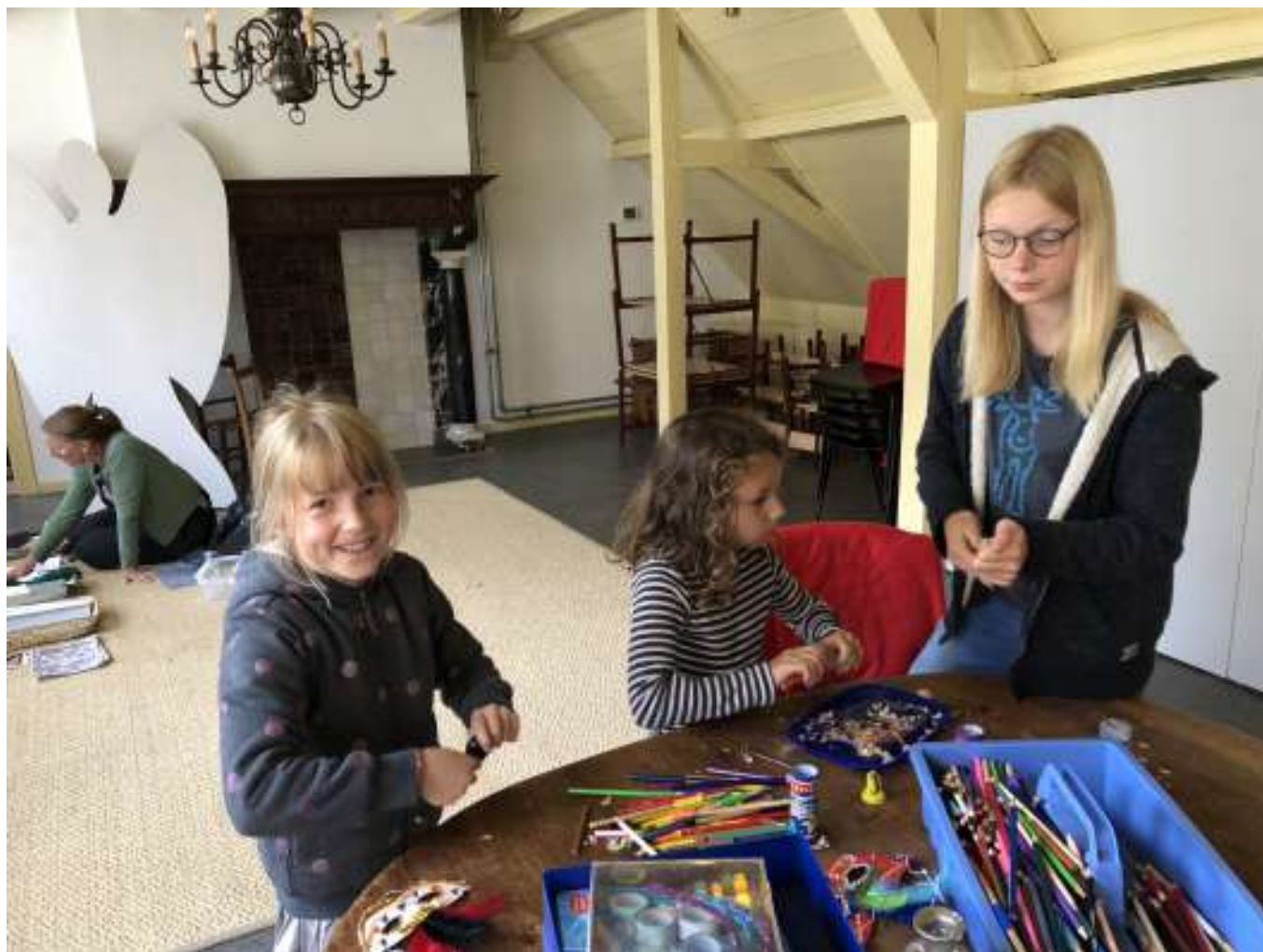
De kinderen van de kindernevendienst hebben op zondag 26 september een grote opruimactie gehouden.