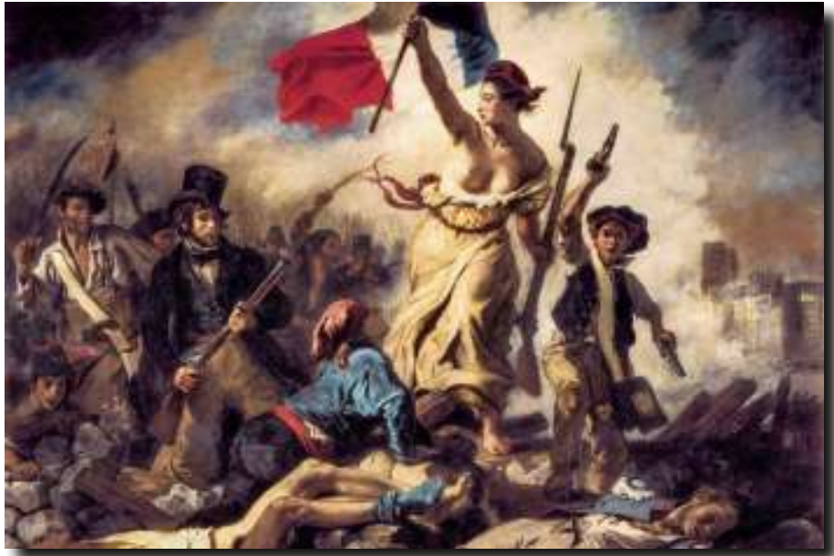
Een vrouwenfiguur werd tijdens de Franse Revolutie het symbool van de opstand. Daarom is ze een toonbeeld van vrijheid in het kunstwerk 'De Vrijheid leidt het volk' uit 1830 van Eugène Delacroix.