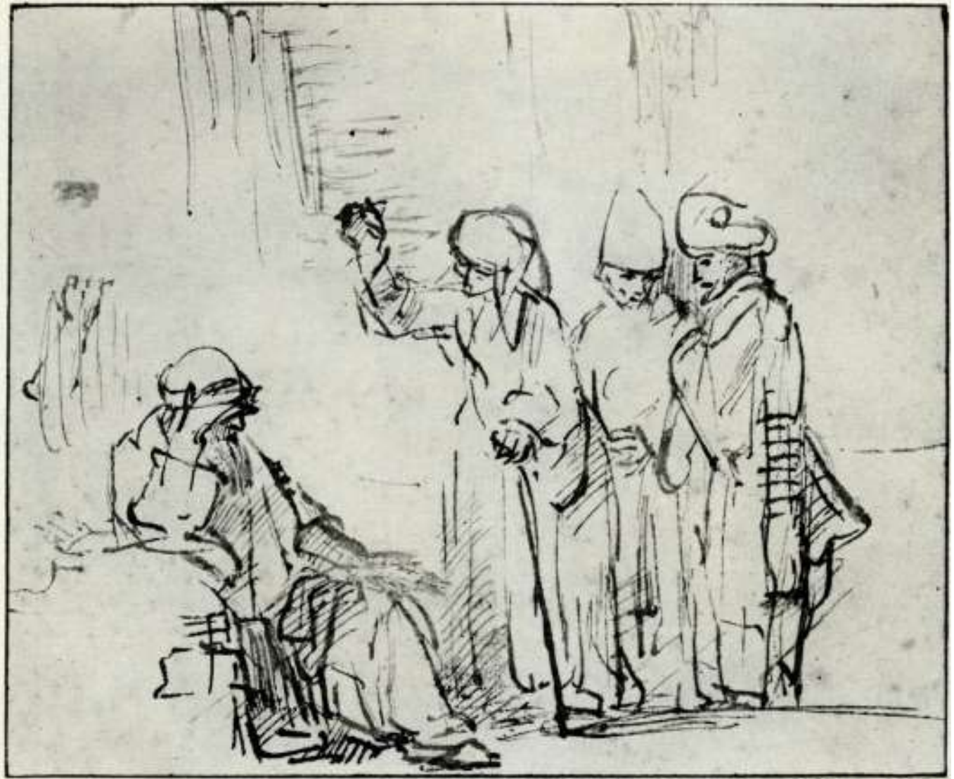
Rembrandt - Job, zijn vrouw en zijn vrienden, 1648-50, 132 x 155 mm

Wat is het voor een God die zegt dat Hij liefde is maar ondertussen je alles afpakt wat je lief is. Job weet dat God goed is, maar zijn vrouw blijkbaar niet.”