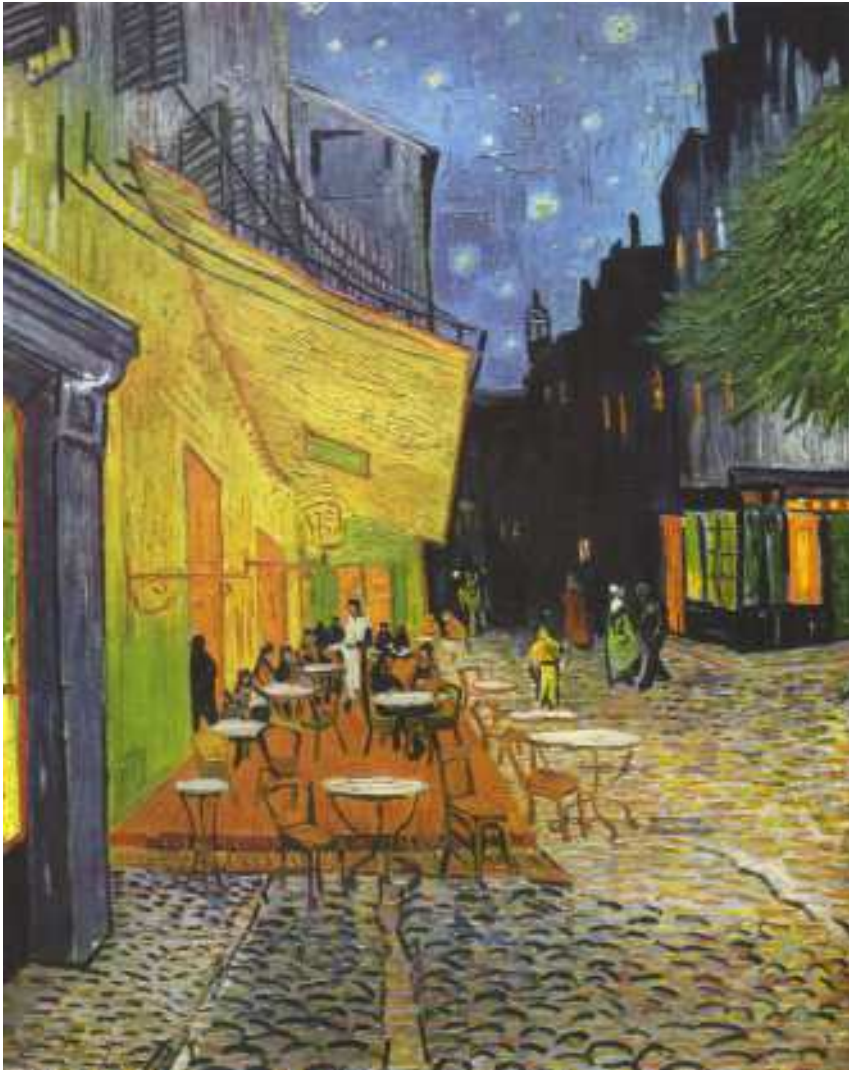
Vincent van Gogh Caféterrassen bij nacht (1888), Arles 81 x 65 cm, Kröller-Müller