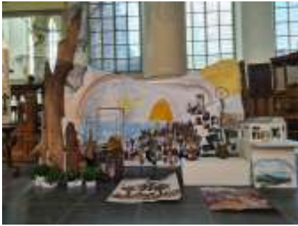
Beeldenstorm Heilige plaatsen zondag 2 mei 2021