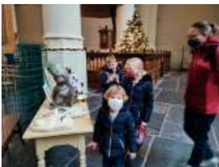
kunstproject met de kinderen zondag 12 december 2021

dere met gedichten ruimte gegeven aan de verbeelding.