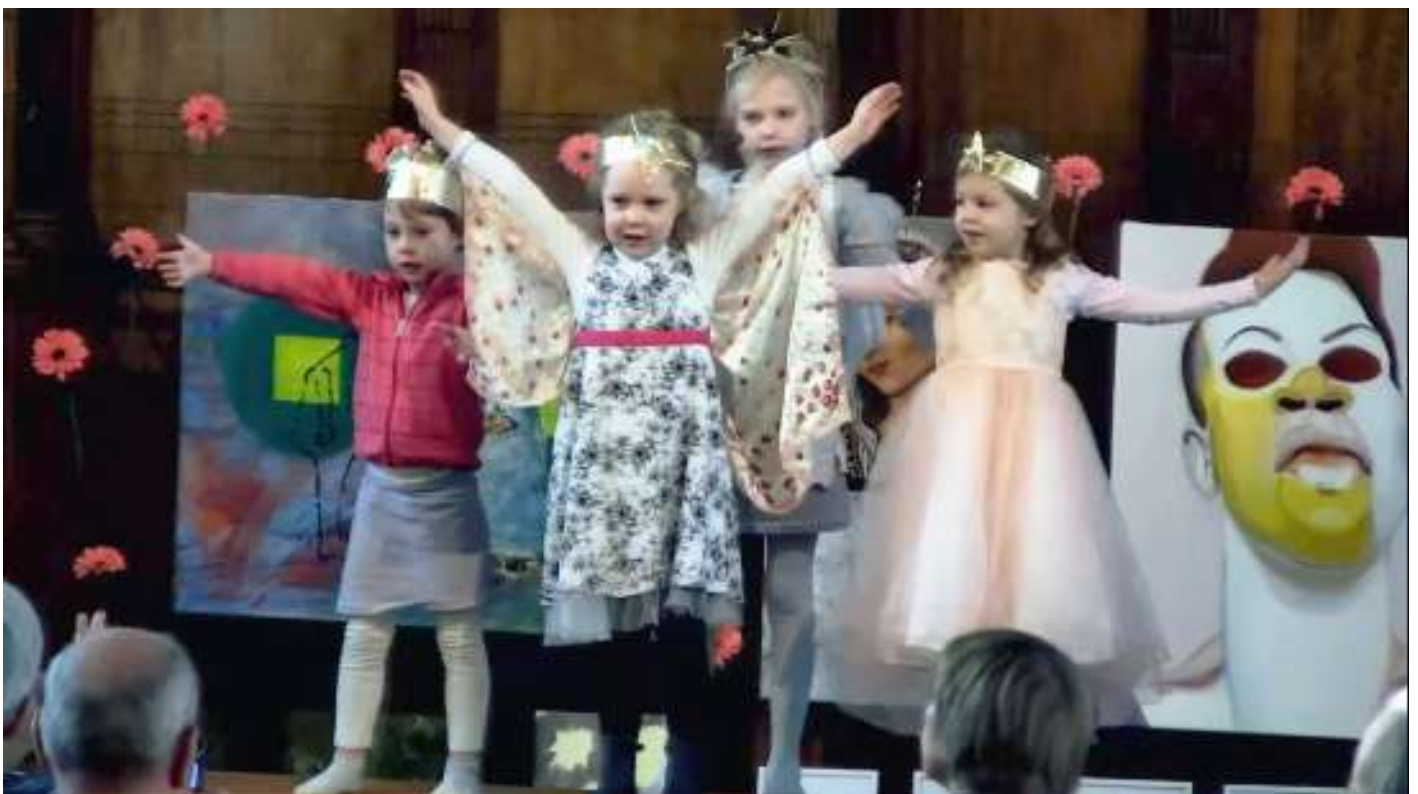
Dans van de kinderen Kerstochtend 25 december 2021

De gespreksgroep Levenskunst/Levens- vragen heeft een vaste kern, maar staat open voor nieuwe deelnemers, ook in de vorm van een eenmalige inloop. Leden van de Ekklesia worden dan ook nadruk- kelijk uitgenodigd tot deelname, door een aankondiging bij 'Actie en Informatie', maar ook door middel van een poster op het informatiebord van de dienst. In prin- cipe kunnen ook niet-leden aan de groep deelnemen.